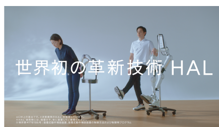
世界初の革新技術