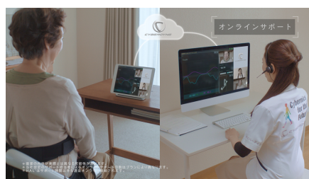
オンラインサポート